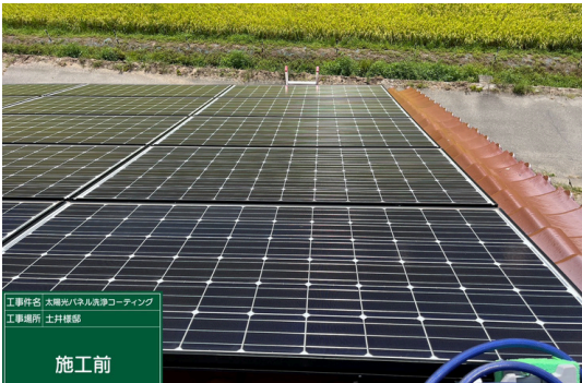
パネル一部施工前