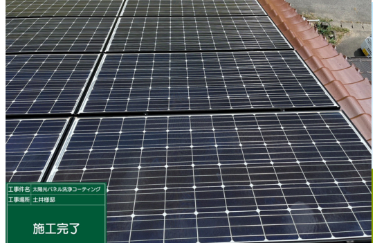
パネル一部施工後