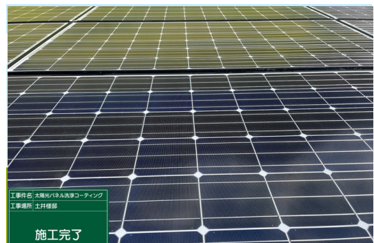
パネル一部施工後