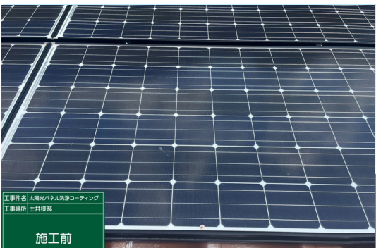
パネル一部施工前